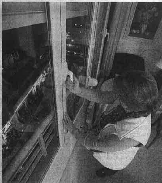
Vecina del bloque Greco cerrando la ventana por el ruido.